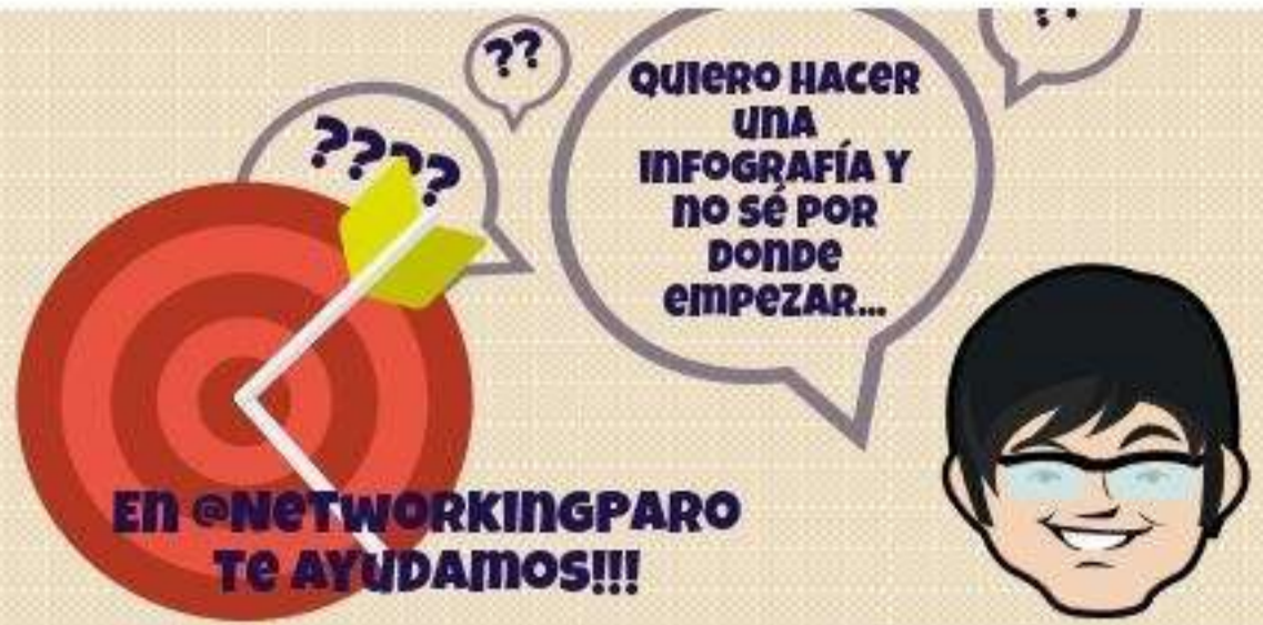
Imagen + Texto Piktochart Easel.ly Canva Visual.ly Infogr.am Mural.ly Venngage

Mapas + Gráficos GeoCommons StatPlanet Hohli Google Chatrs Tools Manyeyes.com Chartsbin Gliffy Google Public Data Explorer Creatly